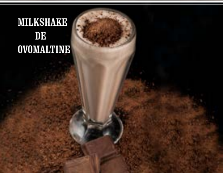
MILKSHAKE DE OVOMALTINE