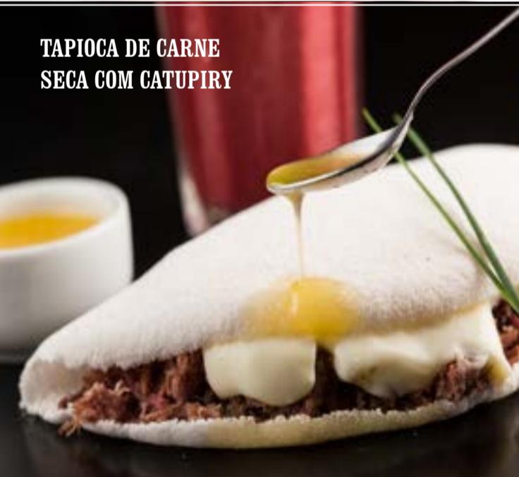
TAPIOCA DE CARNE SECA COM CATUPIRY