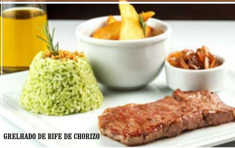
GRELHADO DE BIFE DE CHORIZO