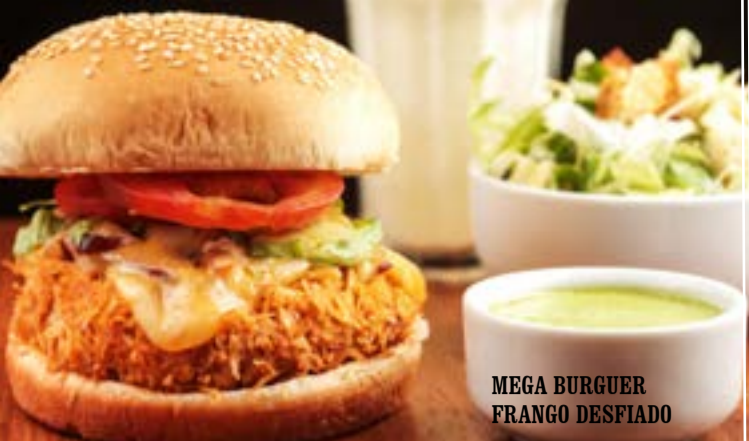
MEGA BURGUER FRANGO DESFIADO