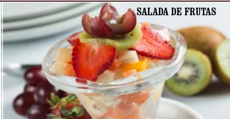
SALADA DE FRUTAS