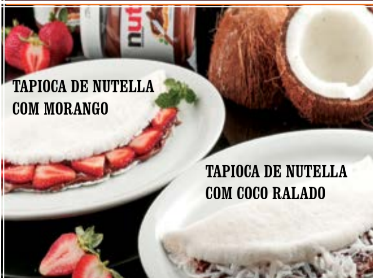
TAPIOCA DE NUTELLA COM MORANGO