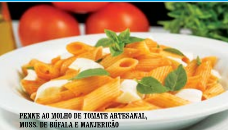
PENNE AO MOLHO DE TOMATE ARTESANAL, MUSS. DE BÚFALA E MANJERICÃO