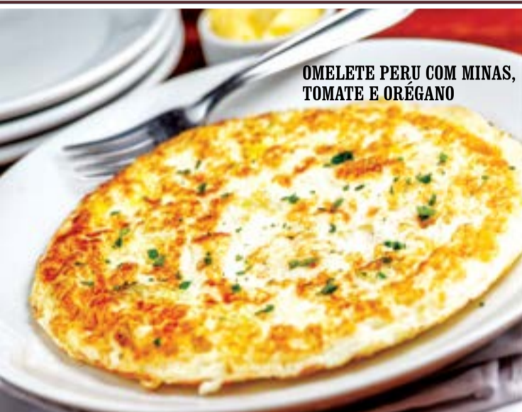
OMELETE PERU COM MINAS, TOMATE E ORÉGANO